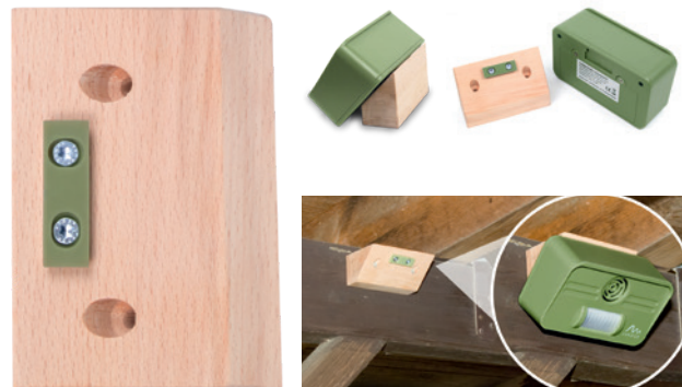
Wandhalterung: Art.-Nr. 60056

Die Wandhalterung ermöglicht die Befestigung im oberen Wandbereich und stellt durch den Winkel sicher, dass der Bewegungsmelder auch auf Bewegungen auf dem Boden reagiert.